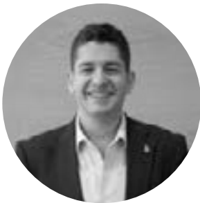
Juan Torrecilla Sinaí Asesores